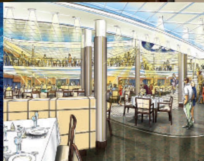
„Galaxy“ mit Kurs auf Bremerhaven: In der Lloyd Werft wandelt sie für TUI Cruises ihr Gesicht;